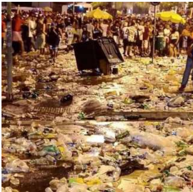
Carnaval SP 23/02