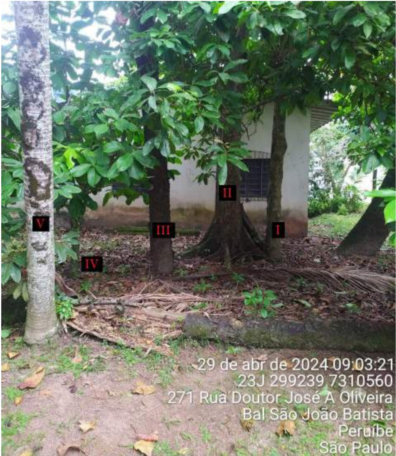
Figura 1: Foto contendo as 5 (cinco) árvores da praça que estão ausentes na planta do projeto e em possível conflito com a construção da quadra.