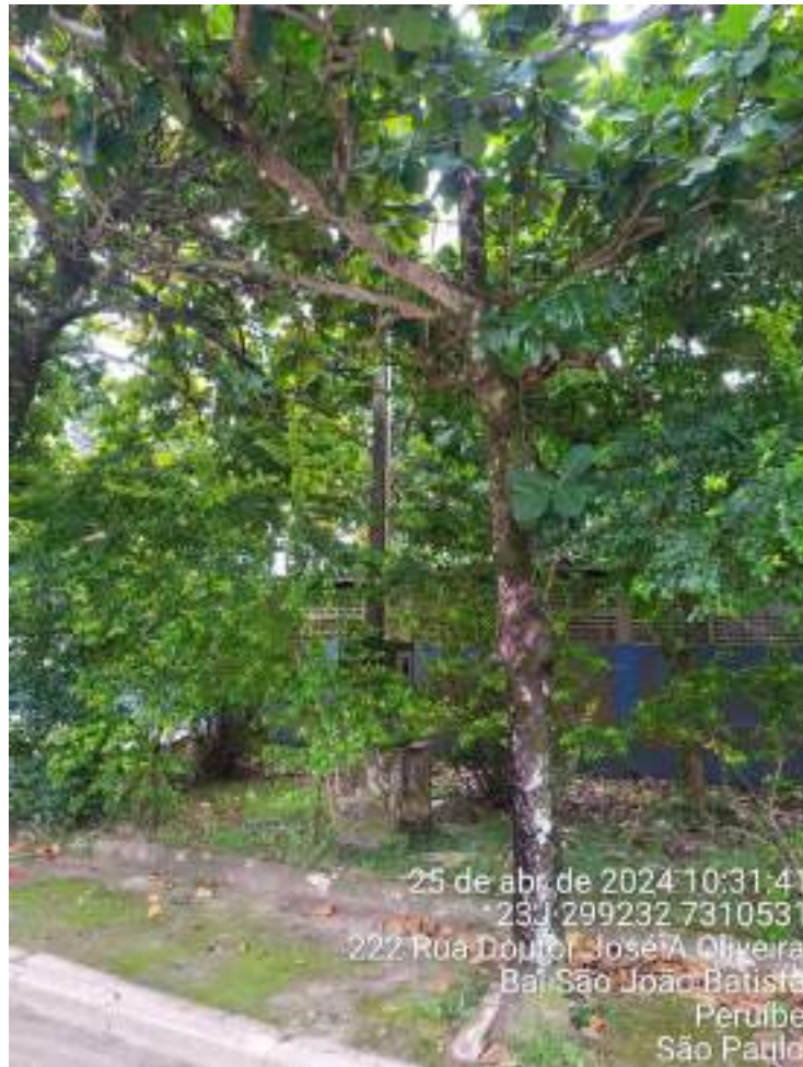
Figura 7: Foto do espécime PEA4, da espécie Terminalia catappa , conhecida como chapéu-de-sol, que precisa de poda de limpeza para remover ramos secos da copa.