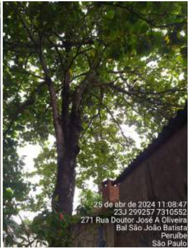
Figura 32 e 33: Fotos do espécime PEA18, da espécie Terminalia catappa , conhecida como chapéu-de-sol, que precisa de poda de limpeza para remover os ramos secos, mortos e parasitados.