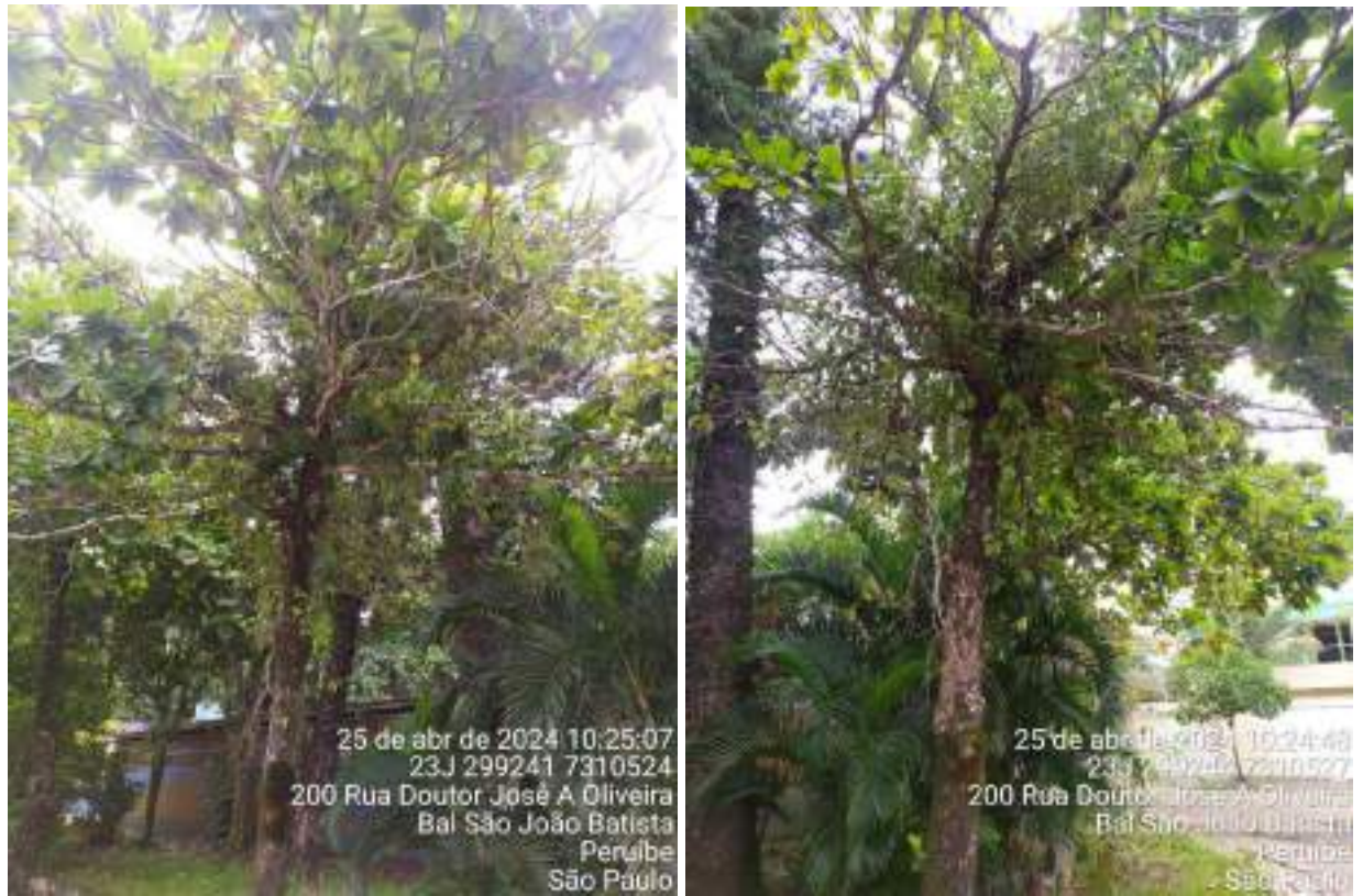
Figuras 3 e 4: Fotos da copa do indivíduo PEA2, da espécie Terminalia catappa , conhecido como Chapéu-de-sol, que necessita de poda de limpeza para remoção de ramos secos e parasitados por erva-de-passarinho.