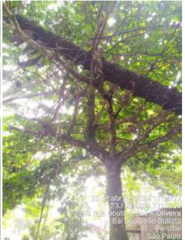
Figuras 28 e 29: Fotos do espécime PEA16, da espécie Terminalia catappa , conhecida como chapéu-de-sol, que precisa de poda de limpeza para remover os ramos secos, mortos e parasitados.