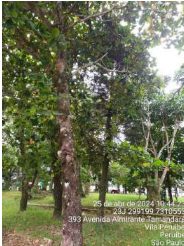
Figura 16: Foto do espécime PEA9, da espécie Terminalia catappa , conhecida como chapéu-de-sol, que precisa de poda de limpeza para remover os ramos secos, mortos e parasitados.