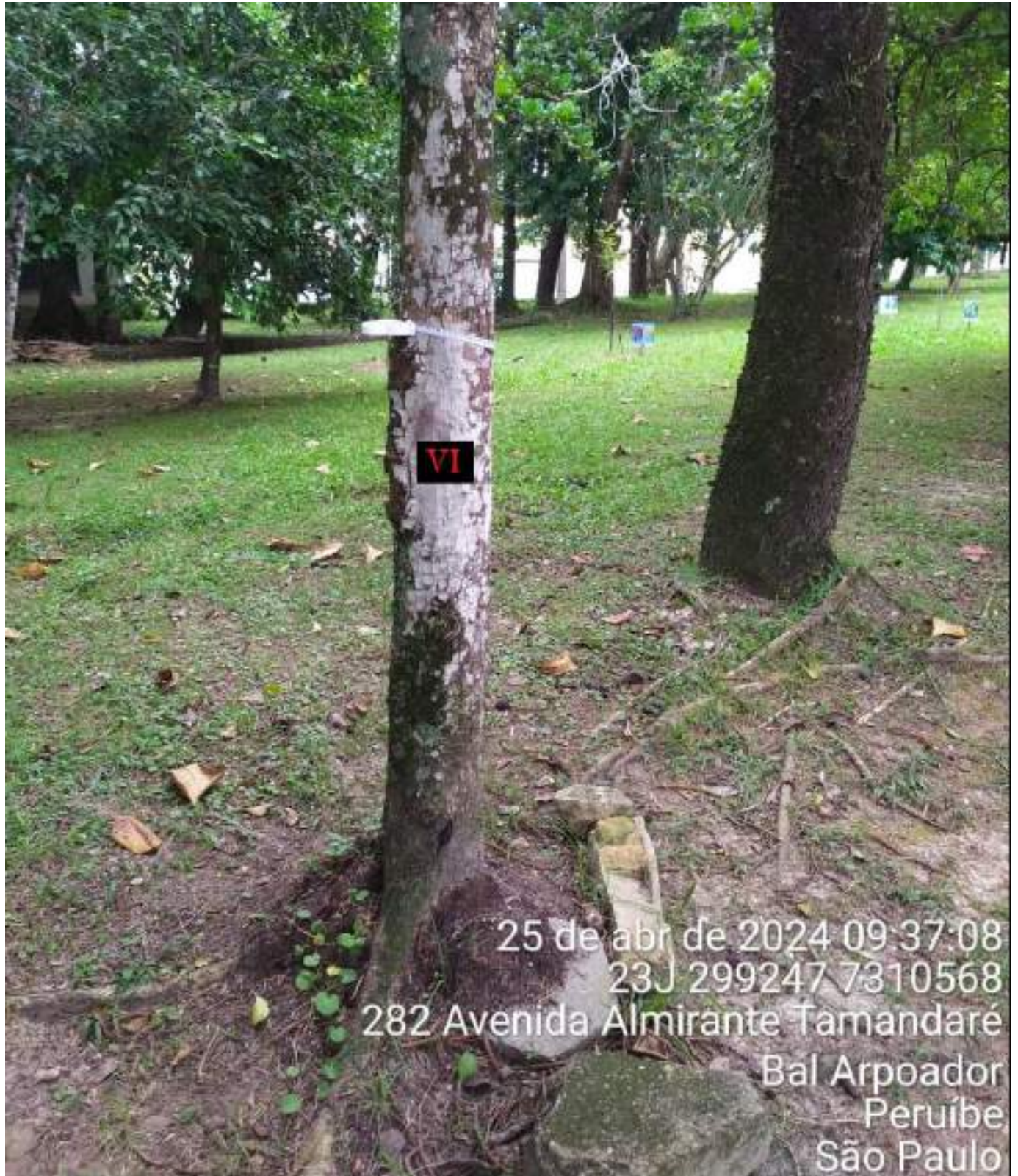
Figura 2: Foto de uma sexta árvore identificada na praça, com DAP maior que 15 e que também se encontra ausente da planta original do projeto