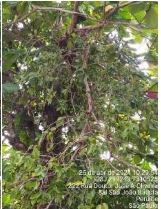
Figura 5 e 6: Fotos da copa do indivíduo PEA3, da espécie Terminalia catappa , conhecido como Chapéu-de-sol, que necessita de poda de limpeza para remoção de ramos secos e parasitados por erva-de-passarinho. Há a presença de ramos pendentes em risco de queda que precisam ser removidos.