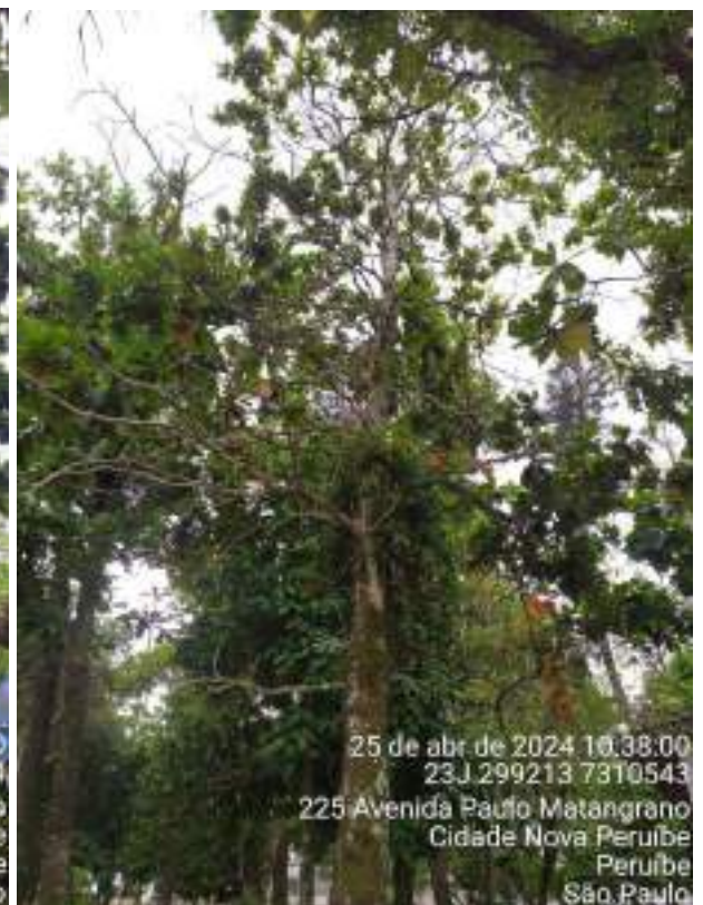
Figuras 12 e 13: Fotos do espécime PEA7, da espécie Terminalia catappa , conhecida como chapéu-de-sol, que já está em estágio avançado de parasitismo e que precisa de poda de limpeza para remover os ramos secos, mortos e parasitados.